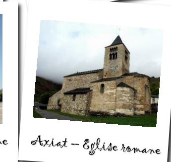
Axiat - Eglise romane