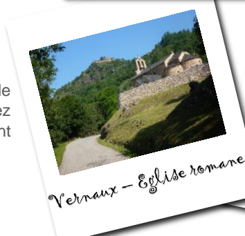
Vernaux - Eglise romane