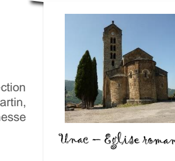
Unac - Eglise romane