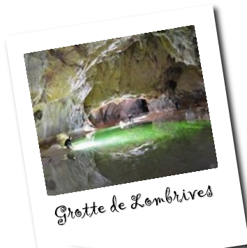
Grotte de Lombrives

Achat des entrées en ligne ou sur place.