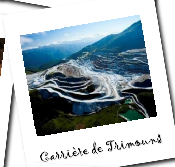
Carrière de Trimouns