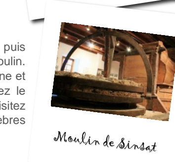
Moulin de Sinsat

Entrée gratuite. Ouverture du lundi au samedi.