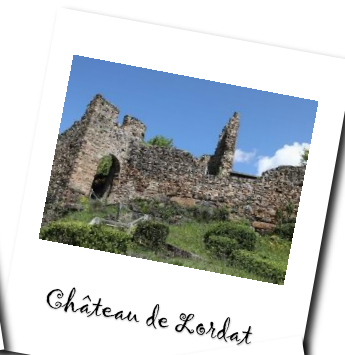
Château de Lordat